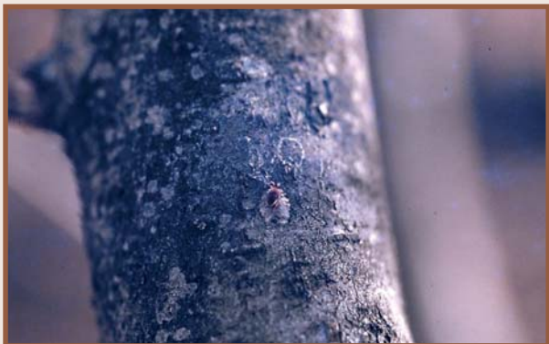
Adult sobre ooplaca (G. Barrios)