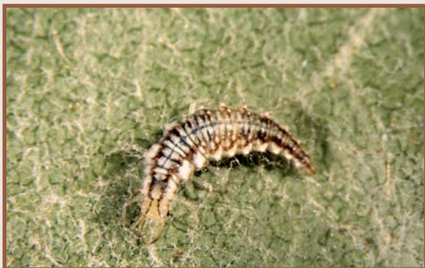
Larva sobre fulla (J. Avilla)