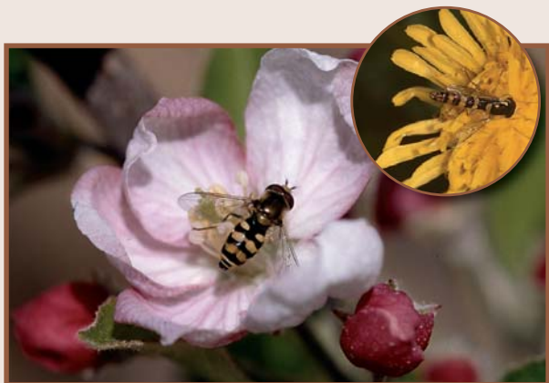
Adults sobre flors (J. Avilla)