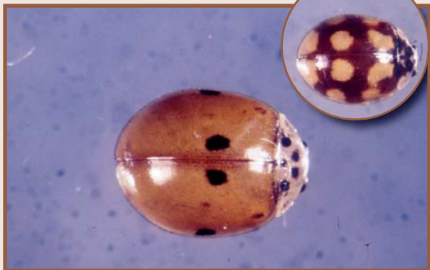
Adults d'Adalia 10-punctata (J.Avilla)