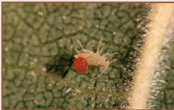
Larva sobre pugó (M. Escofet)