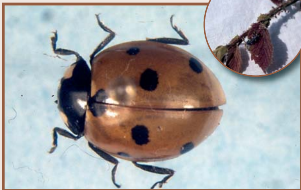
Adult i larva en un avellaner (J. Avilla i G. Barrios)